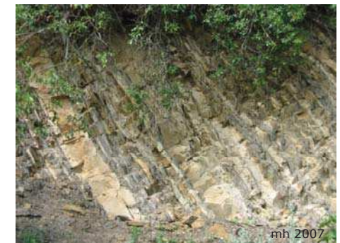
Marine Sedimente der Laa-Formation am Wagram in Eggendorf