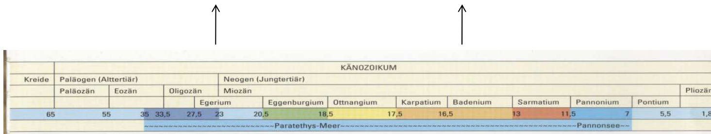
Zeitskala aus Steininger & Steiner (2005)